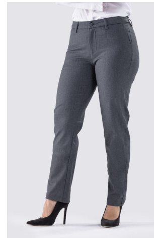
Pantalón de vestir.

Diseño que distingue a tu equipo al instante